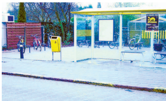
Er komen geen bussen door het smalle centrum van Niel. De bussen blijven via de Antwerpsestraat komen. Hier de bushalte aan de Stationsstraat die vorig jaar door de gemeente volledig vernieuwd werd.

De beslissing is definitief. De nieuwe busverbinding die langs Niel-West zou rijden, komt er niet. De Nielse gemeenteraad bekrachtigde in februari het advies van het schepencollege.