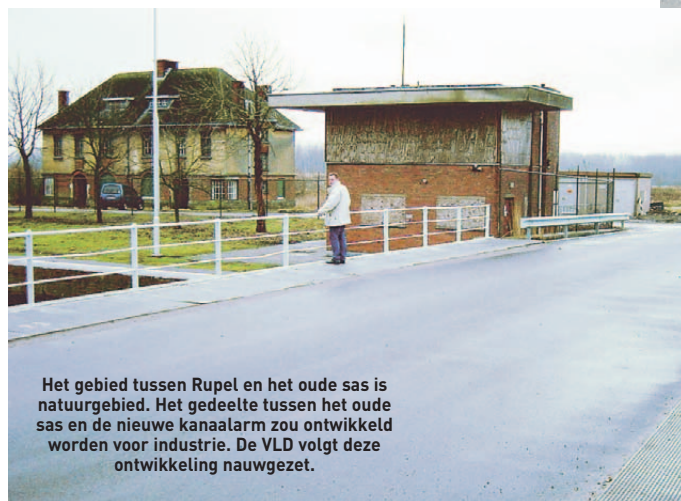
Het gebied tussen Rupel en het oude sas is natuurgebied. Het gedeelte tussen het oude sas en de nieuwe kanaalarm zou ontwikkeld worden voor industrie. De VLD volgt deze ontwikkeling nauwgezet.

Gelukkig voor Niel zorgde het ontegeningsbesluit van de Vlaamse regering van 12/4/2003 voor het behoud van het "zuidelijk eiland", natte weilanden van