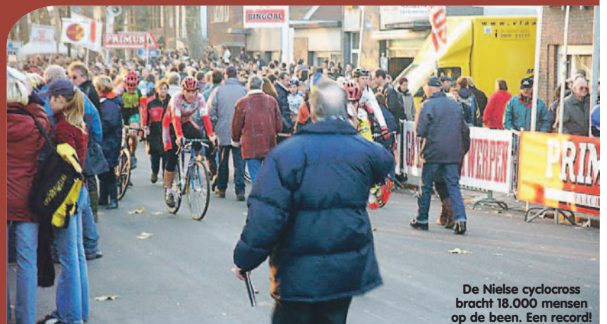
De Nielse cyclocross bracht 18.000 mensen op de been. Een record!

In de wedstrijd zelf was wereldkampioen Bart Wellens de sterkste, voor Sven Nys en Ben Berden. Wellens was een maat sterker dan de rest, waardoor de wedstrijd snel beslist was, maar dat lieten de toeschouwers niet aan hun hart komen. De grootste winnaar op 11 november was niemand minder dan de sportliefhebber die met volle teugen genoot van de wedstrijd en natuurlijk ook van de ambiance erna in de overvolle Nielse cafés.