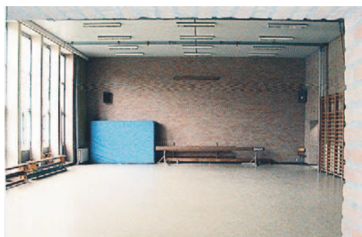
Ook deze turnzaal wordt eigendom van de gemeente. Ze is nog in goede staat, dus een aanwinst voor de gemeente.