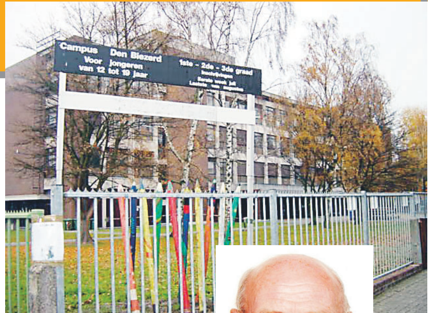
De kinderopvang zal vanaf voorjaar 2004 in 't Speelhuis en ook op Campus De Biezard van KTA plaatsvinden.