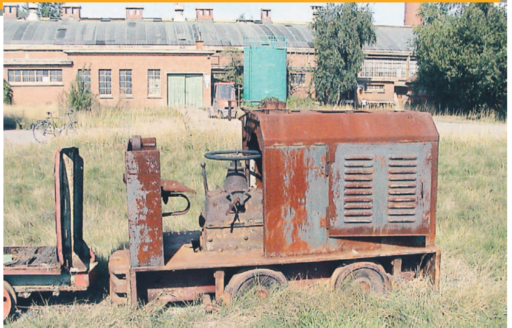
Het gemeentebestuur is sinds kort de eigenaar van het laatste Nielse "duveltje".

De komst van een nieuwe busverbinding (opgelegd door De Lijn omwille van het basisdecreet mobiliteit: er moet een bushalte voor iedere Vlaming op