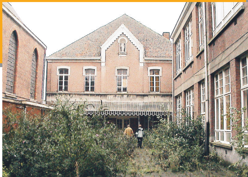
De oude school in de Dorpsstraat is nu eigendom van de gemeente. Zo komt er zekerheid over de toekomst van de turnzaal St Hubertusschool en jeugdhuis Jokot

ook voor jeugdhuis Jokot. Na twee jaar van geduldige voorbereiding kregen wij uiteindelijk de kogel door de kerk. Tussen het gemeentebestuur van Niel en de vertegenwoordigers van parochie en dekenij werd immers een akkoord bereikt. De overeenkomst voorziet in de aankoop van het volledige complex door de intercommunale IGEAN, in opdracht van de gemeente Niel. De gemeente garandeert aan de Sint-Hubertusschool een gebruiksrecht voor de turnzaal, die in de toekomst, zoals de andere gemeentelijke gebouwen zal beheerd worden. Dit laat de gemeente toe de zaal een multifunctionele bestemming te geven na de schooluren. Ook jeugdhuis "JOKOT" krijgt