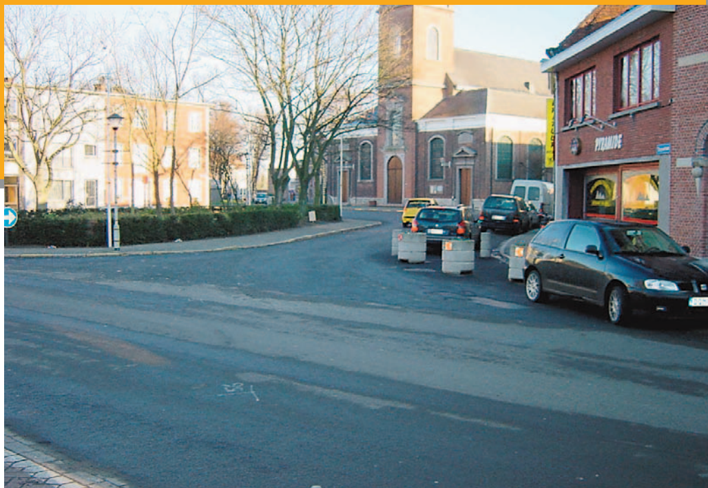
Het pleintje tussen kerk en gemeentehuis geeft zoveel meer mogelijkheden. Tijd voor aanpassingen! Laat ons uw gedacht weten.

Creatieve denkers kunnen ook hier één en ander realiseren. Waarbij natuurlijk de wekelijkse