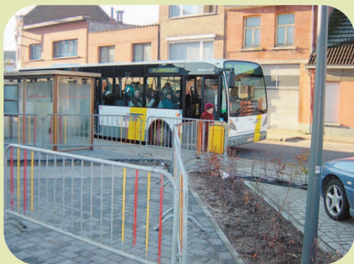
De nachtbusen zullen vanaf oktober ook Niel aandoen.