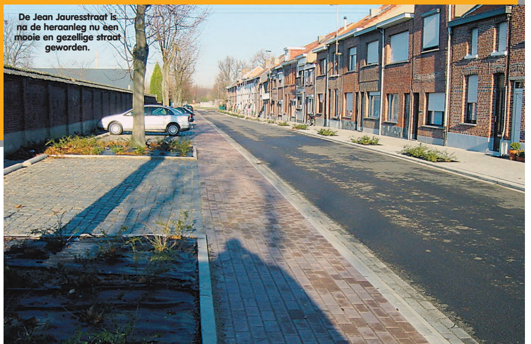
De Jean Jauresstraat is na de heraanleg nu een mooie en gezellige straat geworden.

De burgemeester was geen partijgenoot, toch zal ik hem zeker missen, ondanks het leeftijdsverschil